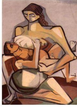
Görsel 5. Cemal Tollu, 1956, "Toprak Ana"