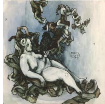
Görsel 9. 30x30 Tual Üzeri Karışık Teknik

Amorf kıvrımlar içine yerleştirdiği Kibele figürlerinde kullandığı boynuzlar kadının gücünü temsil ederken, şişman ve iri göğüslü yapısı ise doğurganlığını ve bereketi simgelemektedir. Amorf kıvrımlar ise “sanatçının iç dünyasında belli konularla ilgili yaşadığı sorunları yansıtmaktadır” (Yayan ve Can, 2021:170). Kullanılan bir diğer form ise kargadır. Karga, Kıyar’ın resimlerinde ölüm ve ölümsüzlüğü temsil etmektedir (Görsel 7,8,9,10).