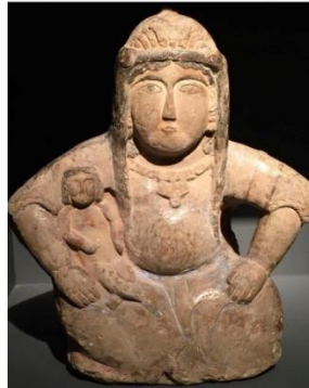
Görsel 3. Umay Ana tasviri olduğu düşünülen Selçuklu Dönemi heykeli