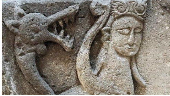
Görsel 4. Kars Ani Harabeleri kazılarında bulunan 13'üncü yüzyıla ait figür.

“İran kökenli halkların mitolojisinde de Humay tanrıçasının adının geçtiğini kayd etmemiz gerekiyor. Açıkça görülmektedir ki, bu tanrıçanın isminin başındaki "h" sesi İran dillerinde ilave edilmiştir ve XI - XVII. yüzyıllarda yaşamış olan Azerbaycan şairlerinin eserlerinde bazen Umay yerine Humay kullanılması da bununla ilgilidir. Lakin bu tanrıça tamamen Türk kökenlidir” ( Geybullayev ve Rızayeva, 1999:216-217).