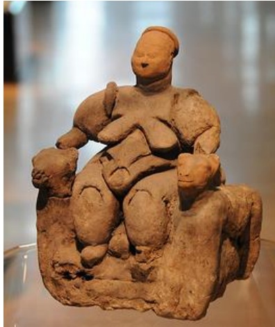
Görsel 1. Anadolu Medeniyetleri Müzesi’nde bulunan Kybele heykelciği