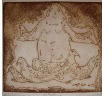
Görsel 13. Can GÖKNİL “Yaratılış Efsaneleri Serisi /Umay Hatun 2” Gravür Baskı