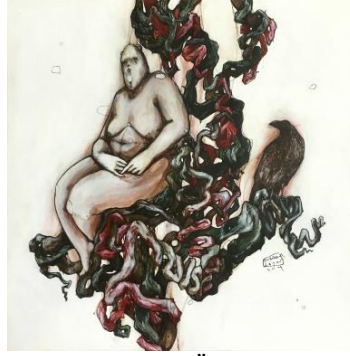
Görsel 10. 40x40 Tual Üzeri Karışık Teknik