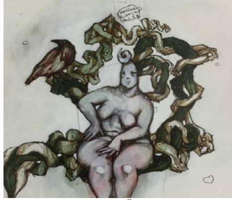
Görsel 7. 30x30 Duralit Üzeri Karışık Teknik