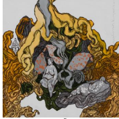
Görsel 8. 63x63 Tual Üzeri Karışık Teknik

Amorf kıvrımlar içine yerleştirdiği Kibele figürlerinde kullandığı boynuzlar kadının gücünü temsil ederken, şişman ve iri göğüslü yapısı ise doğurganlığını ve bereketi simgelemektedir. Amorf kıvrımlar ise “sanatçının iç dünyasında belli konularla ilgili yaşadığı sorunları yansıtmaktadır” (Yayan ve Can, 2021:170). Kullanılan bir diğer form ise kargadır. Karga, Kıyar’ın resimlerinde ölüm ve ölümsüzlüğü temsil etmektedir (Görsel 7,8,9,10).