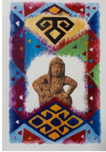
Görsel 15. Barış Bozok, “Umay Ana”, 21x29cm, Karışık Teknik, 2022

incelenmektedir. Sanatçının 2022 yılından ürettiği “Umay Ana” isimli eseri (Görsel 15) karışık teknikle yapılmış uluslararası bir sergide gösterime giren son dönem çalışmalarındandır.