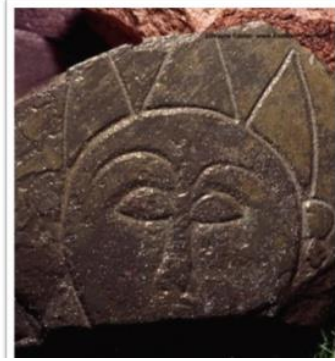
Görsel 2. Taş üzerine yapılmış Umay tasviri, Taraz Kastayev Devlet Müzesi

Araştırmalar göstermektedir ki eski Türk toplumlarının inançları arasında Umay adı verilen bir tanrıça vardır. Yazılı olarak en eski kaynaklardan Orhun Anıtları'nda şöyle geçmektedir; Kültegin Abidesi Doğu cephesinde "Babam hakan öldüğü vakit küçük kardeşim Kültegin yedi yaşında kalmıştı. Umay'a benzeyen annem hatunun taliine", Tonyukuk Abidesi, 2. Taş, Batı tarafında ise "ve; Tanrı, Umay, kutsal yer, sular (bizim için onlara) gaflet verdi" yazmaktadır. Ögel (1982) ise, "Tanrıça Umay'a benzer annem hatunun kutu ile erlik adını aldı" şeklinde okumuştur (Ergin, 1980, Ögel, 1982). "Antik çağda yaşamış olan Strabon'ın şimdiki Azerbaycan arazisinde yaşamış olan Albanlar hakkında yazdığı "Onlar Ay tanrıçasına tapıyorlardı" cümlesinin de göz önünde bulundurulması gerekmektedir" (Geybullayev ve Rızayeva, 1999:217). Literatürde Umay isminin Türkçe "Ay" kelimesinden ortaya çıktığı savını destekleyen birçok araştırma vardır.