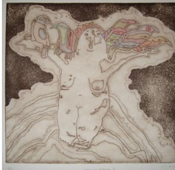
Görsel 12. Can GÖKNİL “Yaratılış Efsaneleri Serisi /Umay Hatun 1” Gravür Baskı

Görsel 11’de ve kollarını iki yana açarak ağaca benzer bir halde tasvir edilen Umay Ana figüründe de (Görsel 12) kullandığı ağaç simgesi, aile ocağını ve aileden çoğalan nesil temsil etmektedir. Kuşlar ise Umay Ana’nın kuş ile ilişkilendirilmesinin yansımasıdır (Görsel 11, 12, 13,14).