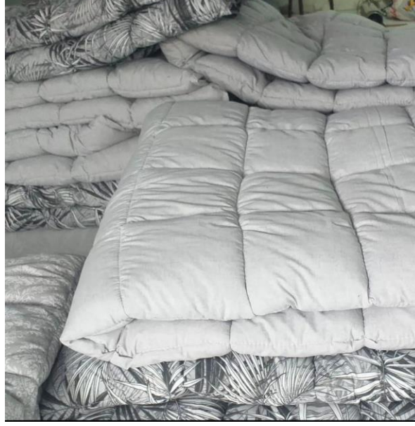
Fotoğraf 19. Kılıfı Geçmemiş Yorganın Astarlı Hali (Özdemir, 2022).

Günlük kullanım amaçlı yapılmış yorganların kılıfı ile çeyize koyulacak yorganın yüzü farklılık göstermektedir. Çeyiz amaçlı yorganlarda daha çok saten kumaş tercih edilirken gündelik amaçlı yorganda sade kumaşlar kullanılmaktadır.