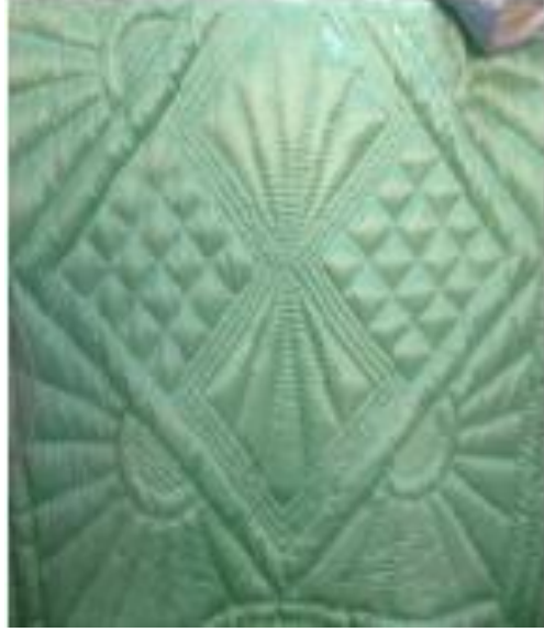
Resim 1. Çerçevesiz Kurdele (Kılıç Karatay, 2017).

Resim 1 Aksaray iline ait bir model iken Fotoğraf 10 Afyonkarahisar iline ait yorgan örneğidir. Resim 1 ile Fotoğraf 10.'da yer alan modeller aynıdır. Fakat modelin aldıkları isim farklıdır. Yorganda işlenen bazı modeller benzerlik gösterse de yöreden yöreye farklı isim almaktadır.