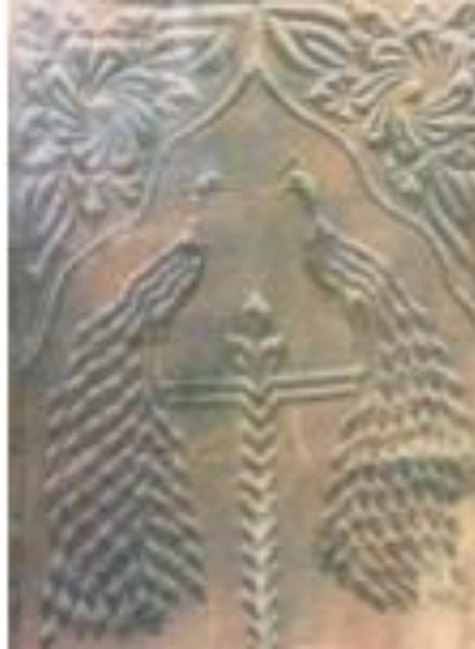
Resim 2. Tavus Kuşu Desenli Yorgan (Kılıç Karatay, 2017).