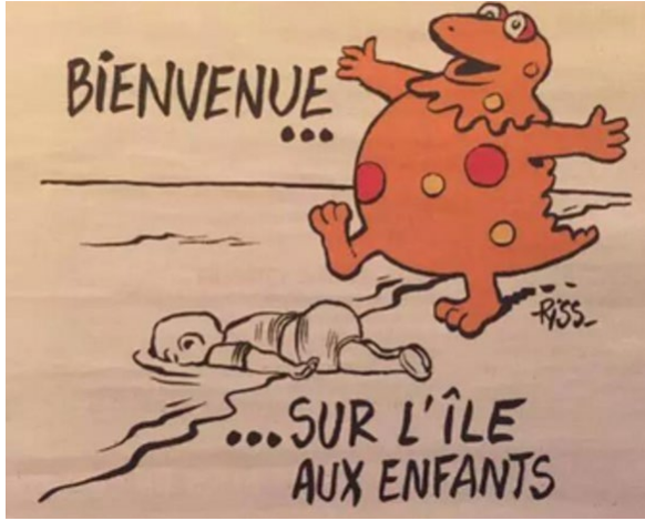
Görsel 7. Aylan Bebek ile İlgili Karikatürü: Çocuklar Adasına Hoş Geldiniz (Dailysabah, 2022)