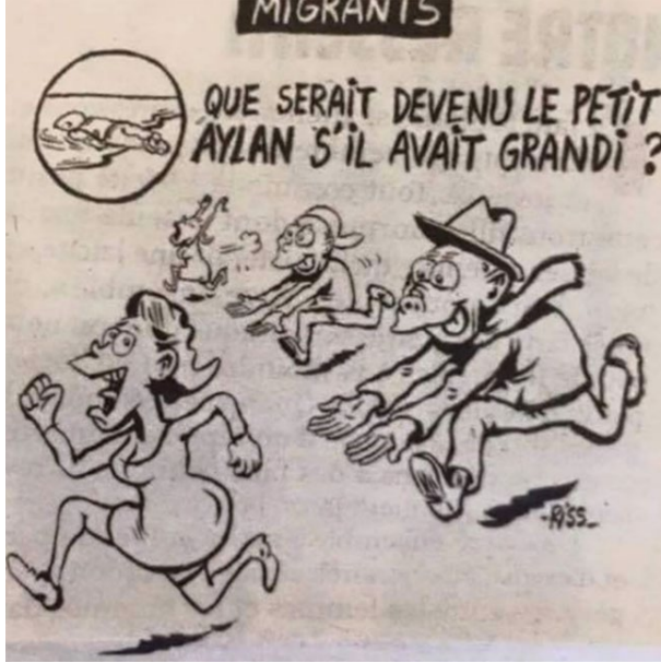
Görsel 5. Aylan Bebek Büyüseydi Ne Olurdu? (Gaiadergi, 2022)

gösterilmiştir (Görsel 5). Daha önce de söz konusu dergi, Aylan Kurdi'nin cansız bedeninin hemen ucunda McDonald's menüsünün reklamı ve Si Près Du But... (Hedefe Çok yakın) cümlesiyle betimlenmiş ve kamuoyunca kınanmıştır (Görsel 6).