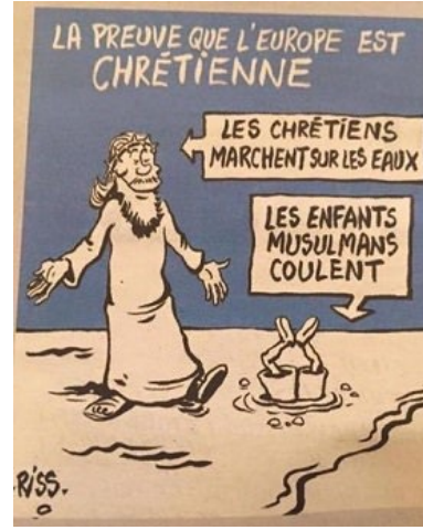
Görsel 8. Aylan Bebek ile İlgili Karikatür: Avrupa'nın Hristiyan Olduğunu Kanıtı (Metro, 2022)