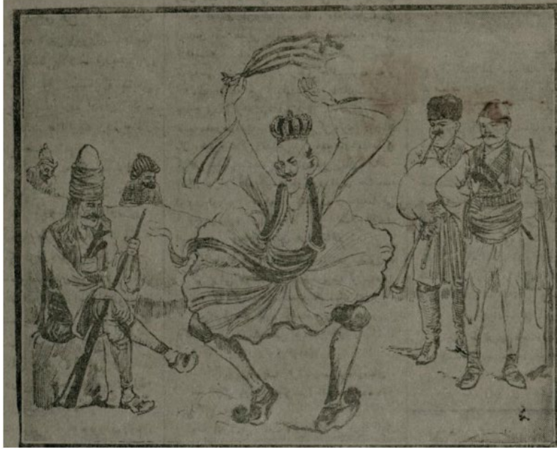
Görsel 2. Yunan Kralı Konstantin Dans Karikatürü (Travlos vd., 2023, 75)

eğlendiren köçek dansı yapan bir çocuk olarak da canlandırılmıştır ki bu kompozisyon da haydutlara Batı Anadolu'nun geleneksel zeybek kıyafetleri, Arnavut pantolonu giyiyor ve Bulgar kıyafetleri giydirilmiştir. Başlıkta, haydutların Yunan Kralını; Türk, Arnavut ve Bulgar dansları yapmaya zorladığı belirtilmiştir (Görsel 2). Karikatürün Türkiye'nin, Yunanistan'ın büyümesine karşı Balkanlar'daki daha geniş bir çabanın parçası olduğu görüşüne bir gönderme olarak yapıldığı iddia edilmektedir (Travlos vd., 2023:75).