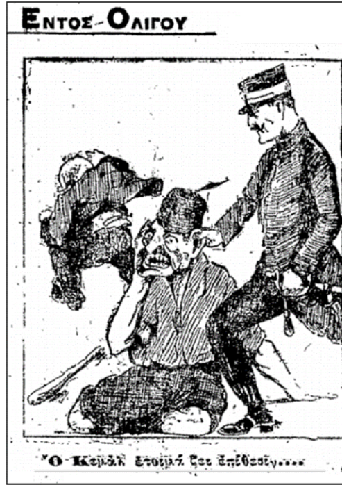
Görsel 1. Kemal Saldırıya Hazırlanıyor (Travlos vd., 2023: 64)

karikatürde (Travlos vd., 2023: 63) Yunan bir asker ayakta bıyıklıdır, yerde oturan ve acı içindeki ise bir Türk'ü temsil ettiği varsayılan fesli ve bıyıklı bir kişidir (Görsel 1). Kulağından çekilirken gösterilen bu illüstrasyonda yanlarında da yerde bir sopa durmaktadır. Arka planda, takım elbiseli kısa, kel bir figür sırtı okuyucuya dönük olarak kaçarken gösterilmiştir. Venizelos'un 2 Skrip'teki diğer tasvirleri dikkate alındığında bu figürün Kasım 1920'deki seçim yenilgisinden sonra bozguna uğrayan Venizelos olduğu anlaşılmaktadır. Başlıkta Kemal Saldırıya Hazırlanıyor yazılmıştır. Burada; Yunanlıların, yurt içindeki rakipleri bozguna uğratarak kibirli ama zayıf yabancı rakiplerini boyun eğmeye zorlamaları tasvir edilmiştir (Travlos vd., 2023: 63-64)