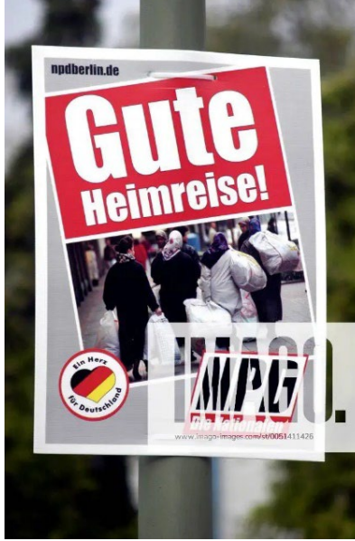
Görsel 4. Guten Heimreise Meine, Afişi (İmago.imajes.de, 2021)

bir psikolojik baskı altında, direniş göstermeden ülkeyi terk etmeye zorlanan mülteciler için sergilenmiştir.